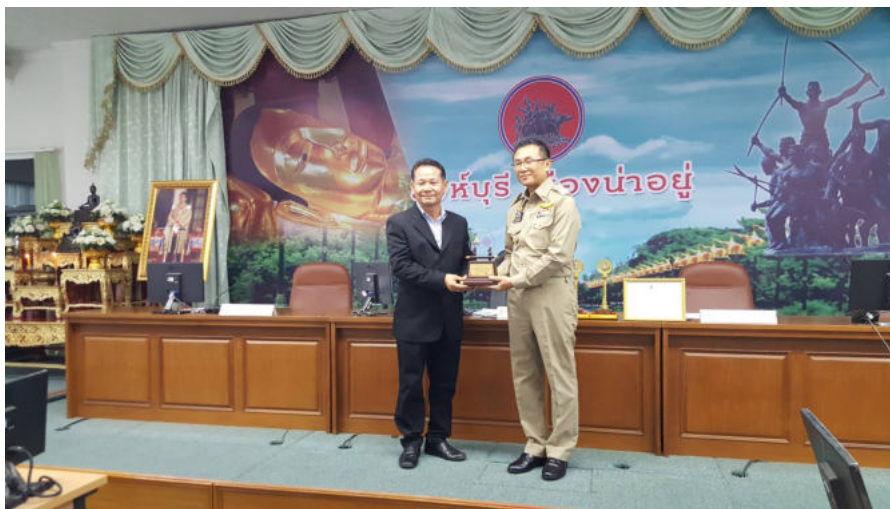
รางวัลชำระเงินสมทบกองทุนประกันสังคมดีเด่น