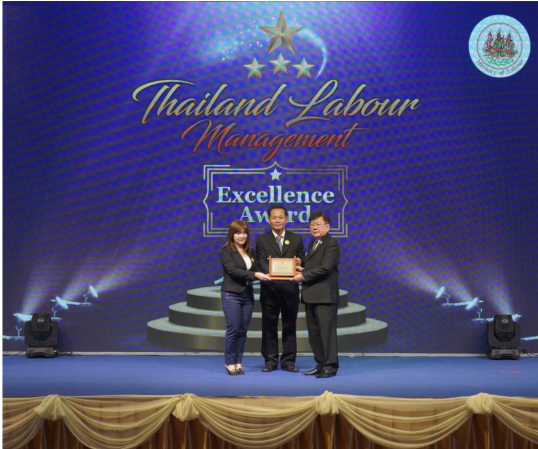
รับรางวัล สถานประกอบการดีเด่น ปีที่ 5