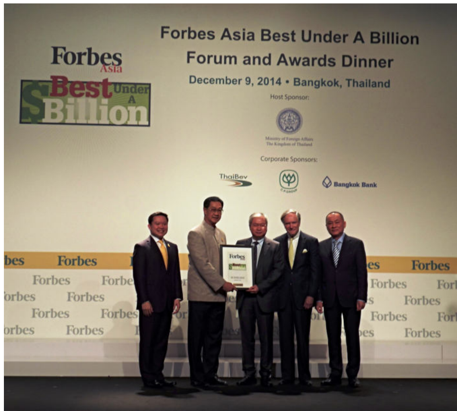
บริษัทฯ ได้รับรางวัล FORBES ASIA BEST UNDER A BILLION 9 ธันวาคม 2557