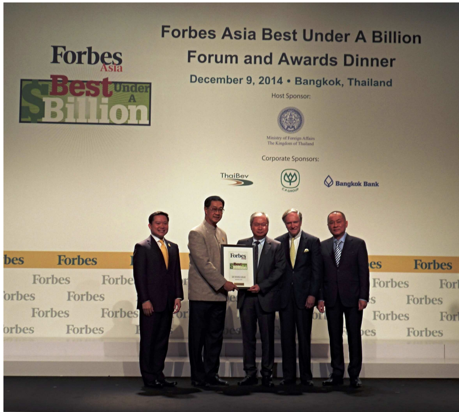
บริษัทฯ ได้รับรางวัล FORBES ASIA BEST UNDER A BILLION 9 ธันวาคม 2557