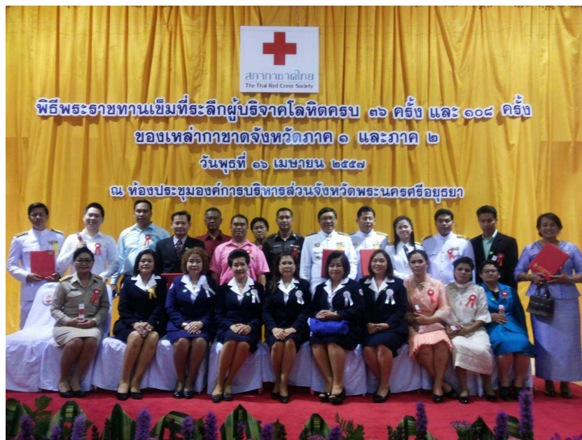
พิธีพระราชทานเข็มที่ระลึกผู้บริจาคโลหิต ของเหล่ากาชาดจังหวัด ภาค 1 และภาค 2 วันที่ 16 เมษายน 2557